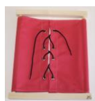
Montessori Outlet. Cadre habillage laçage