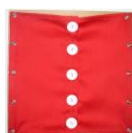
Montessori Outlet. Cadre habillage boutons