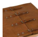
Montessori Outlet. Cadre habillage boucles