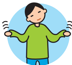
Présente des comportements bizarres