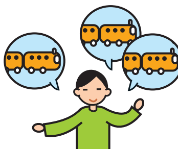
Parle de façon incessante sur un sujet particulier