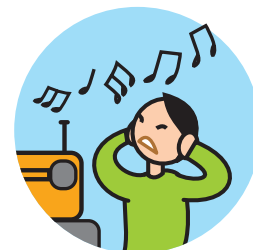
Peut être hypersensible aux sons, aux odeurs ...