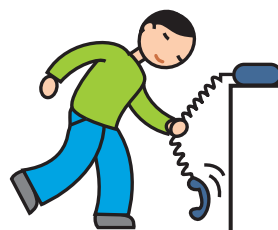
Utilise les objets de façon atypique