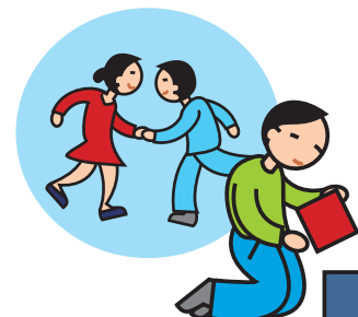
Ne joue pas avec les autres enfants