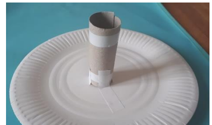
Image à imprimer et découper

Attention à imprimer en cochant impression en « taille réelle » !